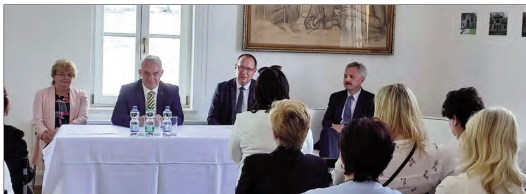
Jednání v Písku

Libuše PAVLÍKOVÁ, garantka sekce nezdravotnických pracovníků, odbory@janskelazne.com