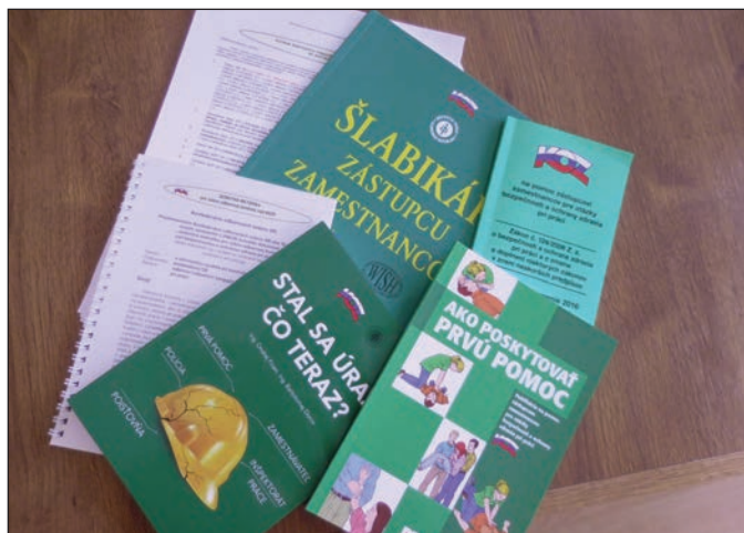
Publikace na téma BOZP