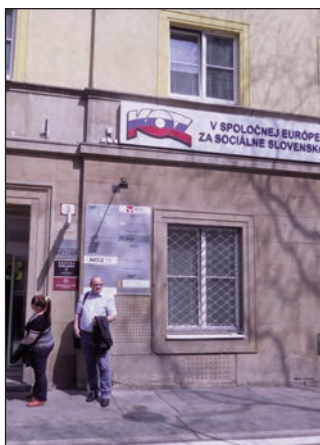
Nové sídlo KOZ SR