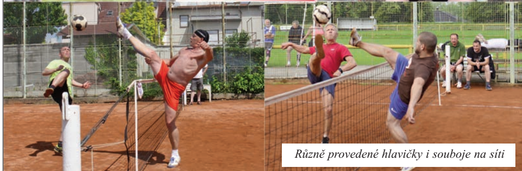
Různě provedené hlavičky i souboje na síti