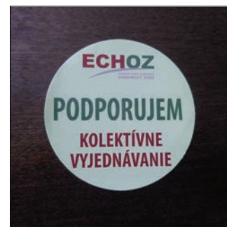
Samolepka Energeticko-chemického odborového svazu