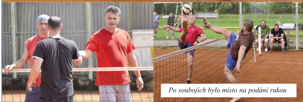
Po soubojích bylo místo na podání rukou