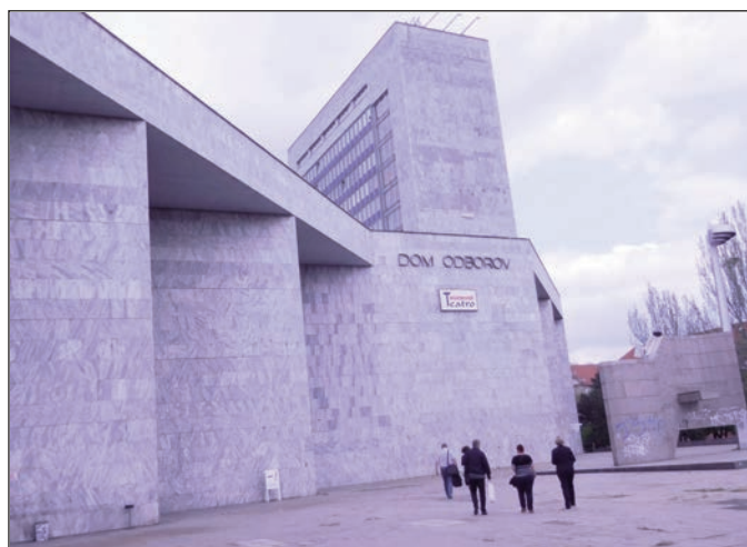
Původní sídlo KOZ SR

Se specialistkou pro ekonomickou politiku a sociální dialog jsme probírali změny, kterými na Slovensku prošel náš původně společný zákon č. 2/1991 Sb., o kolektivním vyjednávání. Dozvěděli jsme se o existenci slovenských zákonů o veřejné službě, o státní službě, o výkonu práce ve veřejném zájmu a zákonu o odměňování zaměstnanců při výkonu práce ve veřejném zájmu. Pro zájemce